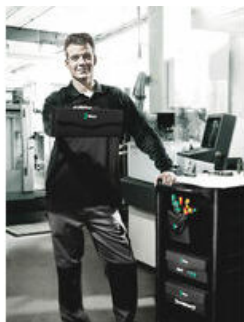
Wera 2go 3 - Taška na nářadí